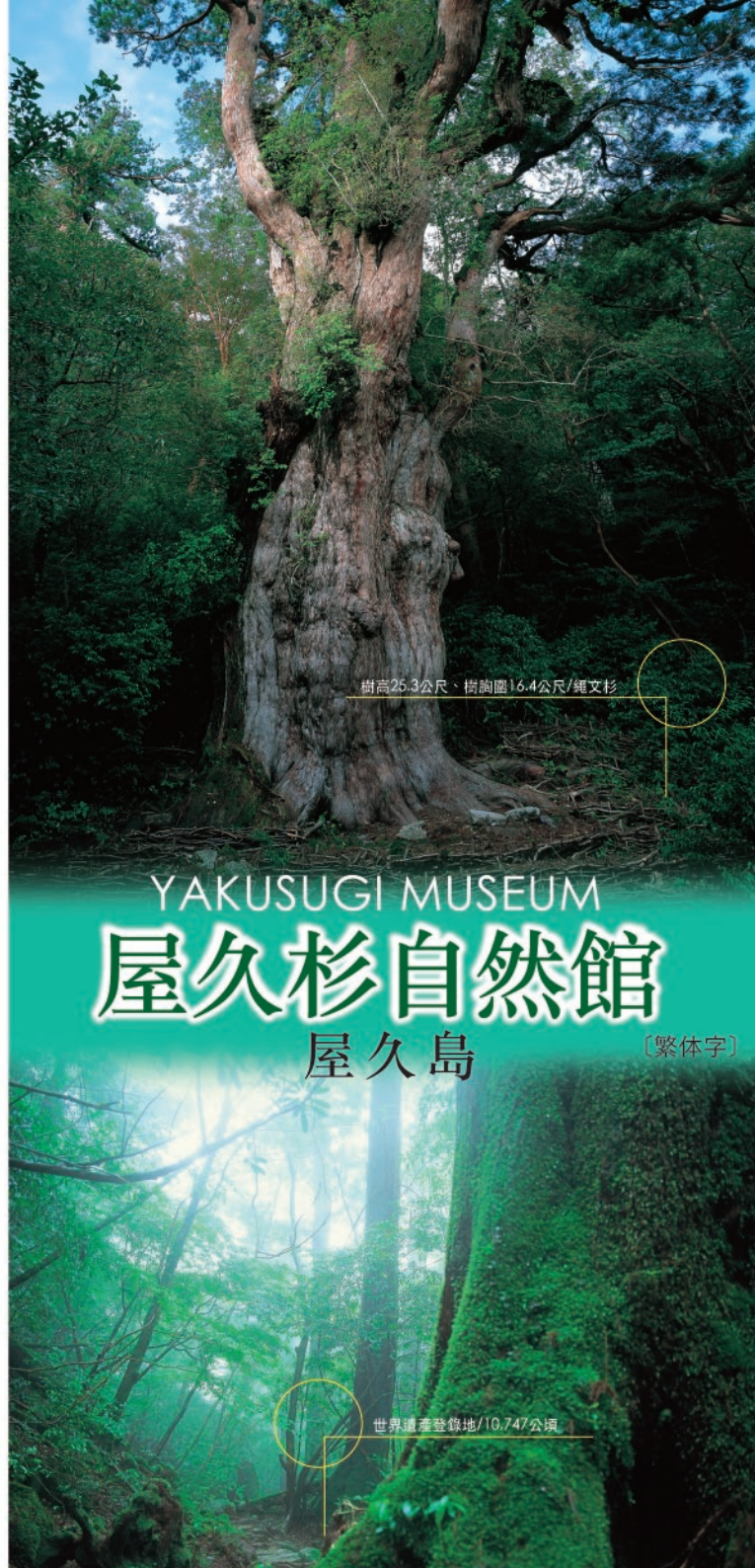
樹高25.3公尺、樹胸圍16.4公尺/繩文杉