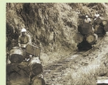
透過軌道斗車搬運屋久杉