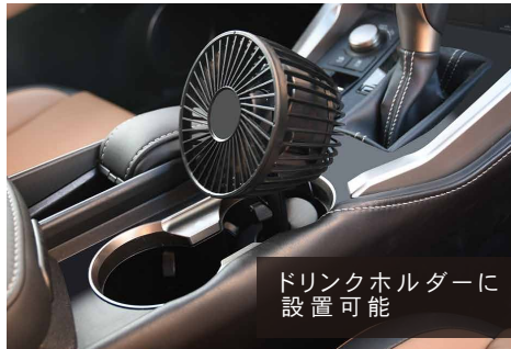
ドリンクホルダーに設置可能