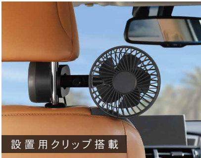
設置用クリップ搭載