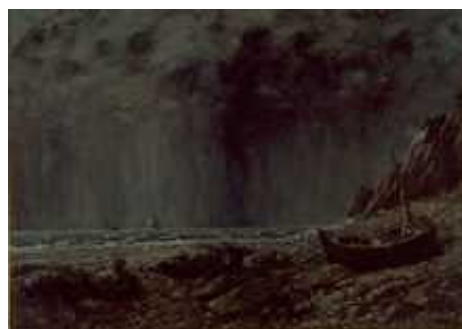
ギユスターヴ・クールベ《嵐》