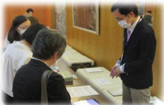
障害者関連サービス資料