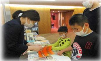
子どもに読んでほしい本 100選