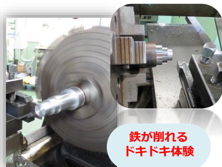
鉄が削れる ドキドキ体験