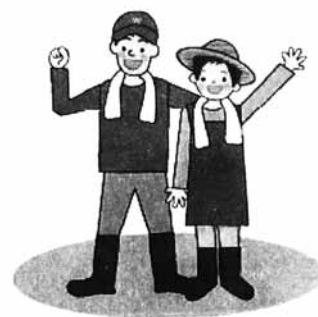
長そで・長ズボンでね！