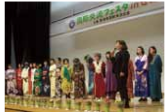
昨年は民族衣装ショーを開催しました

国際交流協会の各委員会が日頃の活動を紹介します。世界のお茶を楽しみながら、異文化に触れてみませんか。 日時=2月4日(日)午後1時から3時30分 会場=生涯学習交流センター2階・多目的ホール 費用=200円(チケット代・KIES事務所で販売) 内容=体験コーナー(書道、着付け、和楽器)、君津高校生と翔凜高校生のダンスパフォーマンス ☎ 君津市国際交流協会(KIES) ☎(54)9877