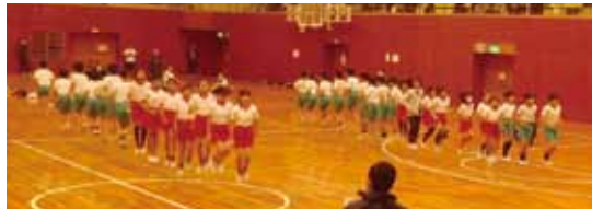
優勝目指してみんなでジャンプ!

会場=市民体育館 参加資格=1年以内に医師の診断、定期健康診断を受けて異常がないと認められた方 ※今大会から、市外在住者も参加できます。 種目・対象=①親子とび・未就学児とその親②時間とび・未就学児から小学2年生③二重とび・小学3年生以上④団体とび・1チーム12人以上(小学生)⑤団体とび・1チーム12人以上(中学生・各部活動での申込)⑥団体とび・1チーム12人以上(④、⑤以外の構成) 持ち物=運動着・体育館シューズ・とび縄(縄の中央部に金具の付かない物)・昼食・靴袋 申込方法=参加申込書に必要事項を明記の上、郵送、