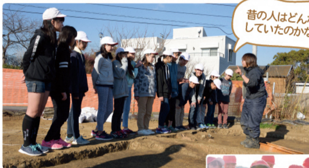
昔の人はどんな暮らしをしていたのかな?

12月5日から7日、貞元小学校の児童が同校区内の上湯江遺跡で発掘された古墳時代の住居跡と出土遺物の見学会を行いました。参加した児童の皆さんは、実際に出土した遺物に触れたり、住居跡を間近で見学したりと、自分たちのまちの歴史を知る時間を楽しんでいました。