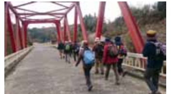
約17kmの道を歩きます

明治時代の上総の若者たちが、「梅ヶ瀬さん」こと日高誠実の元で学ぶために通った道を歩きます。