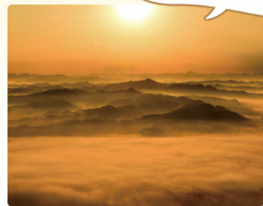
2017年11月16日撮影の雲海