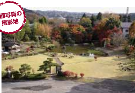
四季折々の景色が楽しめる青葉高校自慢の庭園です