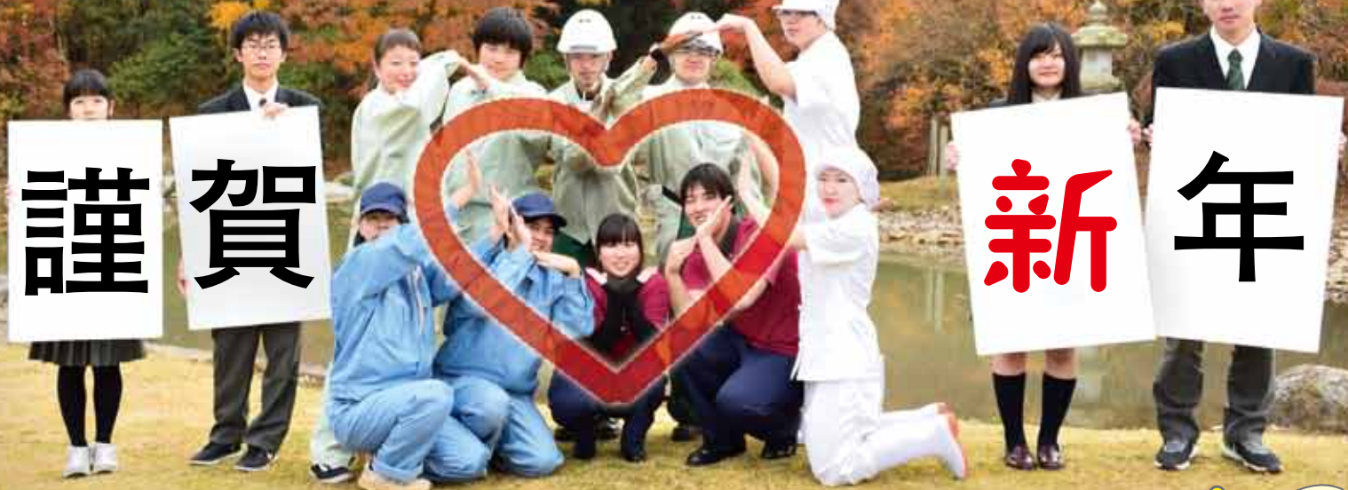
創立100周年を迎えた君津青葉高校の生徒の皆さん