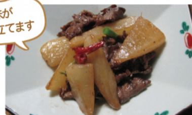
ピリ辛の風味が食欲をかき立てます