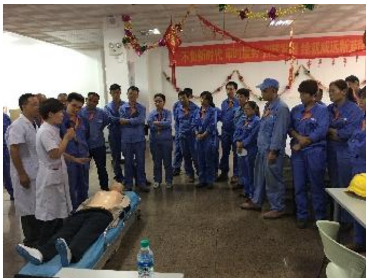
(5) 对公司实习的大学生进行安全知识培训