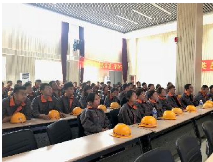
(6) 将承包商作业人员纳入公司培训体系,开展安全培训